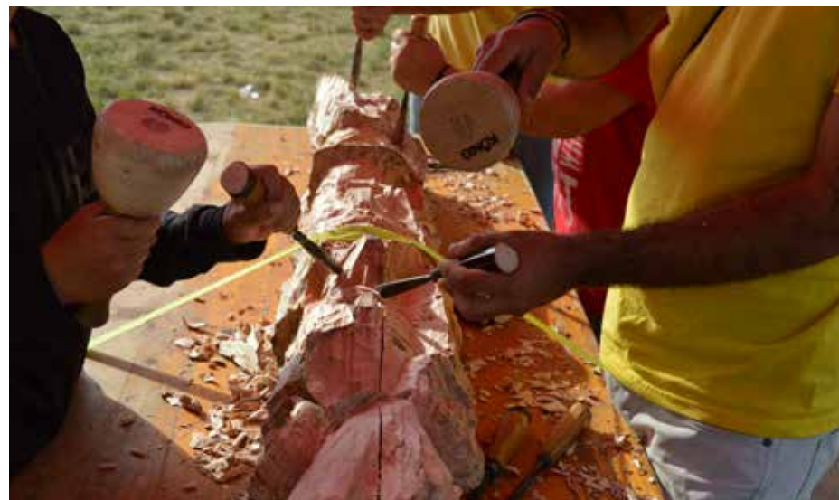
la Tournée Arachnima

Ce trimestre annonce encore de belles coopérations, permettant de consolider le travail collectif engagé dans chaque coin du quartier.